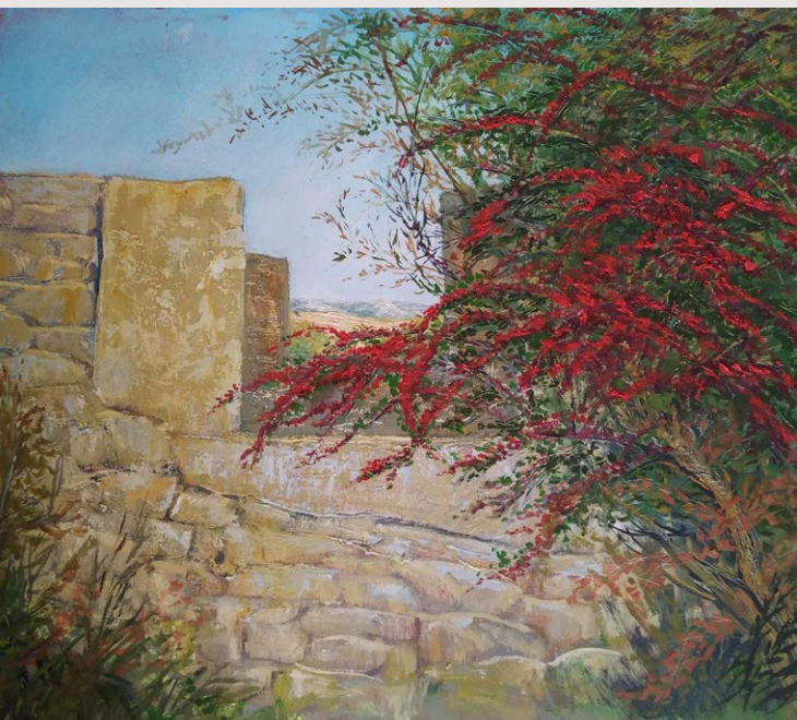
Lagar tradicional. Ventana.