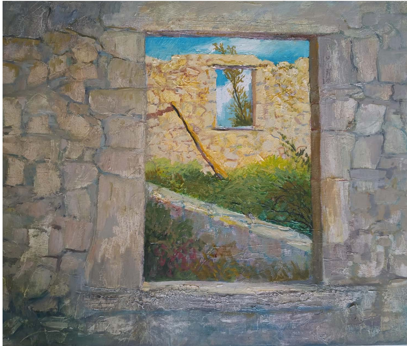
Lagar tradicional. Ventana.