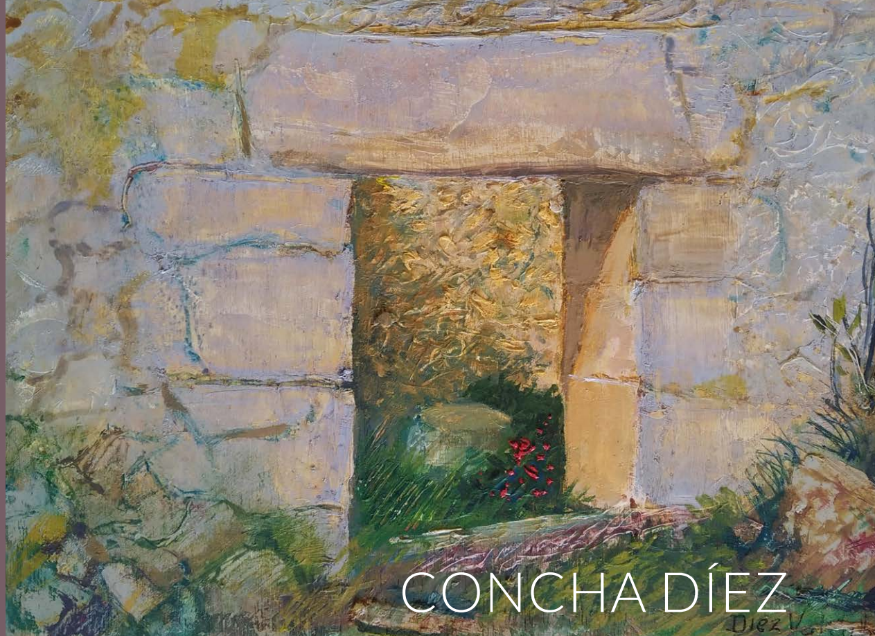
Puerta y piedra de lagar.